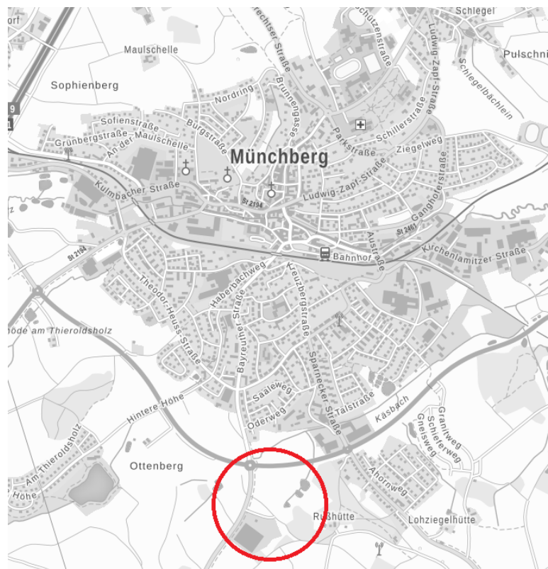
Abb. 1: Übersichtslageplan

Der Stadtrat von Münchberg hat am 12.05.2022 beschlossen, den Bebauungsplan Nr. 49 „Gewerbegebiet am Steinweg“ mit integriertem Grünordnungsplan aufzustellen. Vorgesehen ist die Ausweisung eines Gewerbegebiets südlich von Münchberg für kleine bis mittelständische Gewerbebetriebe. Die Aufstellung des Bebauungsplans bedingt ebenfalls eine Änderung des Flächennutzungs- und Landschaftsplans der Stadt Münchberg, da ehemals für die Landwirtschaft ausgewiesene Flächen nun Fläche für Gewerbe werden sollen. Desweiteren werden Flächen für Regenrückhaltebecken, Ausgleichsflächen sowie Grünflächen im Gebiet neu verteilt. (s. nachfolgenden Übersichtslageplan).