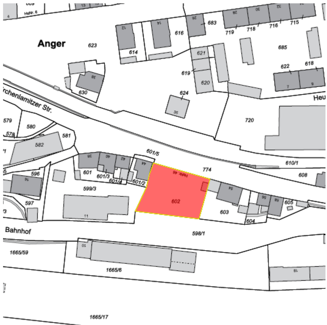
Flurkarte © LVG Bayern, Nr. 5576/ 08 - Lageplan: kein Maßstab

Bezeichnung: Kirchenlamitzer Str. 46 Flur-Nummer: 602, Gemarkung Münchberg Größe: ca. 900 m 2 (muss noch vermessen werden) Bebaubarkeit: Baugrundstück für Einzelhaus Kaufpreis: ca. 60,-€/m 2 Nähere Informationen unter: Stadtbauamt