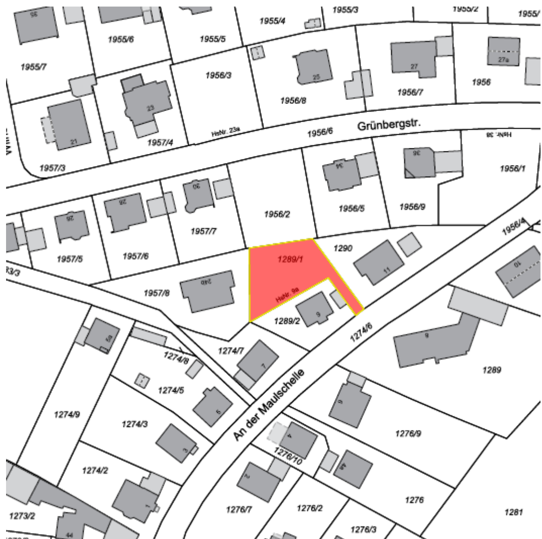
Flurkarte © LVG Bayern, Nr. 5576/ 08 - Lageplan: kein Maßstab

Bezeichnung: An der Mauschelle 9a Flur-Nummer: 1289/1, Gemarkung Münchberg Größe: ca. 577 m 2 Bebaubarkeit: Baugrundstück für Einzelhaus Kaufpreis: ca. 85,- €/m 2 Nähere Informationen unter: Stadtbauamt