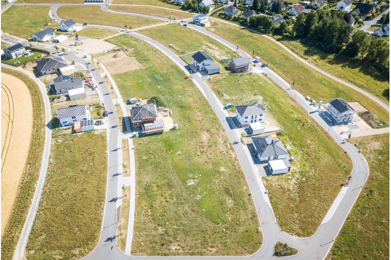
Neubaugebiet Steinleithe – Drohnenaufnahme