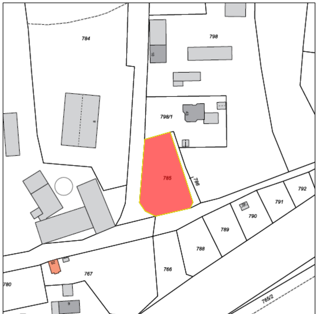
Flurkarte © LVG Bayern, Nr. 5576/ 08 - Lageplan: kein Maßstab

Bezeichnung: In Schödlas Flur-Nummer: 785, Gemarkung Straas Größe: 1.092 m 2 Bebaubarkeit: Baugrundstück für Einzelhaus Kaufpreis: Verhandlungssache Nähere Informationen unter 0160/96933959