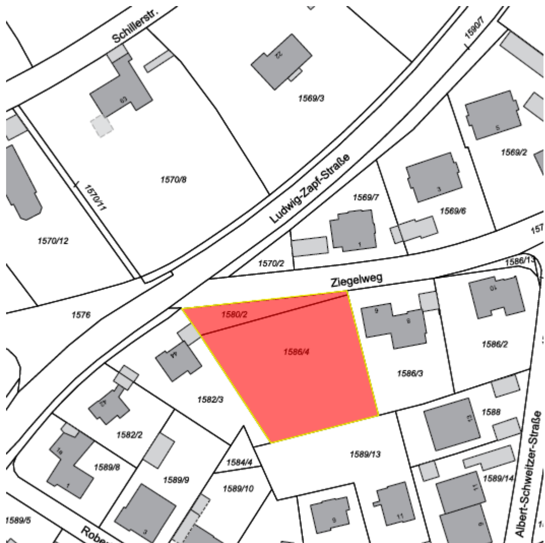
Flurkarte © LVG Bayern, Nr. 5576/ 08 - Lageplan: kein Maßstab

Bezeichnung: Nähe Ziegelweg 6 Flur-Nummer: 1586/4 + 1580/2, Gemarkung Münchberg Größe: ca. 2.194 m 2 Grundstück kann geteilt werden Bebaubarkeit: Baugrundstück für ein oder mehrere Einzelhäuser Kaufpreis: ca. 90,-€/m 2 Nähere Informationen unter: 09251/46122