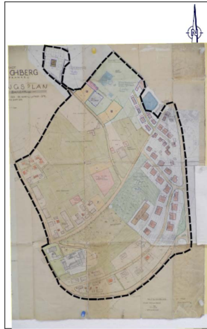
Geltungsbereich mit analoger Grundkarte Stand 1963/1977